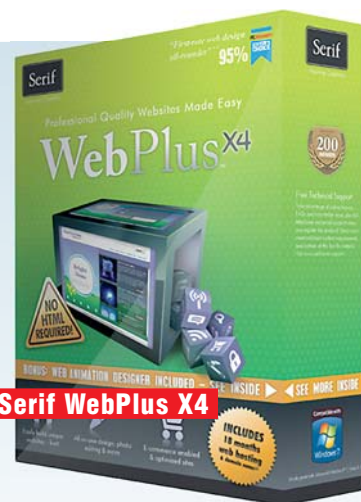
Serif WebPlus X4

Альтернатива. Kaspersky Crystal — комплексная защита для семейного использования (2200 рублей на два ПК).