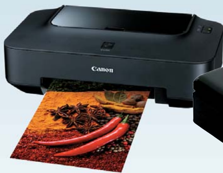
Canon Pixma iP2700