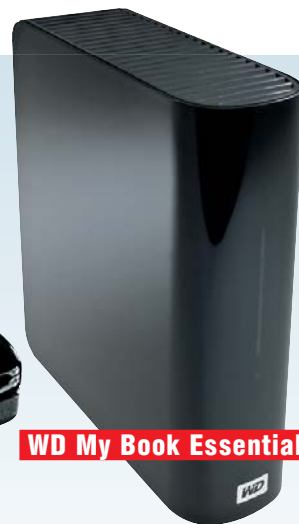
WD My Book Essential

Альтернатива. Более дорогой стационарный роутер Netgear MBRN3000.